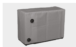
Fundas de protección